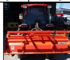
トラクター30馬力(A/C付)