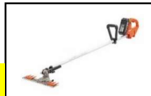
草刈機(T字型バリカン)