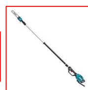
充電式高枝チェーンソー