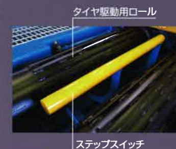
タイヤ駆動用ロール

ラチェットブレーキの採用により制動力を向上。車輛の退出時にはタイヤ駆動用ロールがしっかりとロックされます。