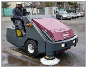
▲回転灯、サイドミラー、方向指示灯 使用例