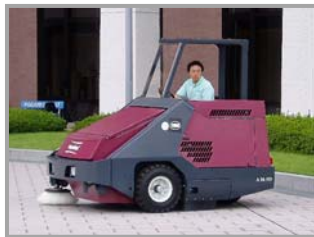
▲オーバーヘッド・ガード使用例