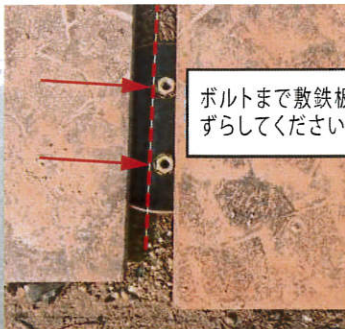
ボルトまで敷鉄板をずらしてください。