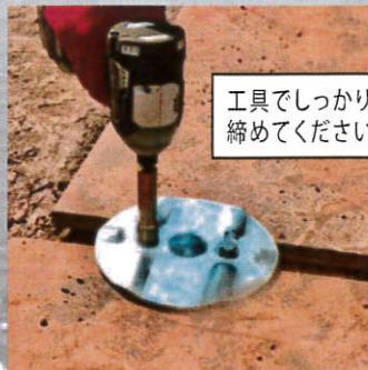
工具でしっかりと締めてください。