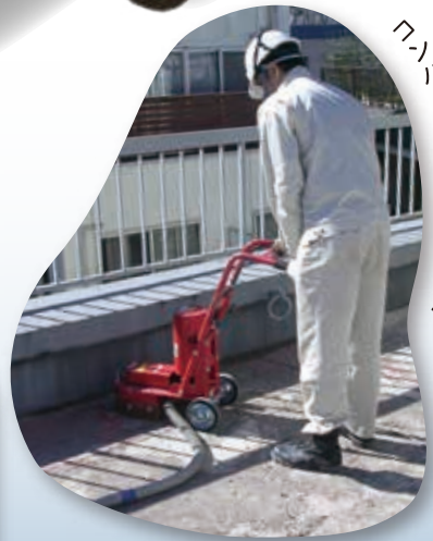
7.6メートルだから小回りバツグン