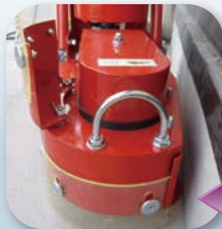
カバーの一部を外して 際 きわ の作業もできる