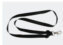
送信機用ストラップ