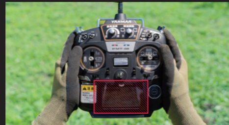
送信機画面で機体の傾斜角度を確認