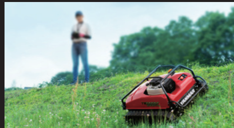
作業がしづらい場所も遠隔操作が可能