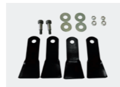
YW500RC 交換用フリーナイフセット (7A1025-43110)