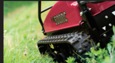
低重心の車体に、走行部はクローラを採用