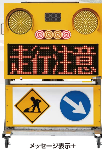
メッセージ表示+ プリンカー(黄色)交互点灯 ※信号機を使用しない場合