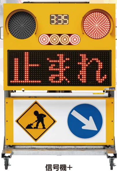
信号機+ メッセージ表示