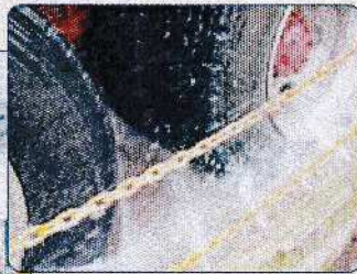
本機は、21~10tの標準ダンプトラック専用の タイヤ洗浄機です。