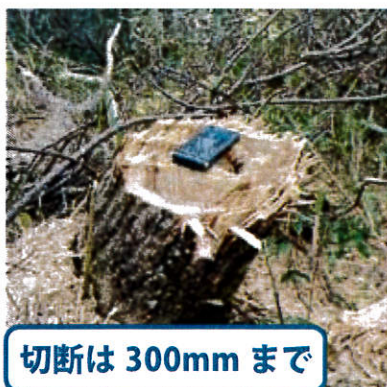
切断は 300mm まで