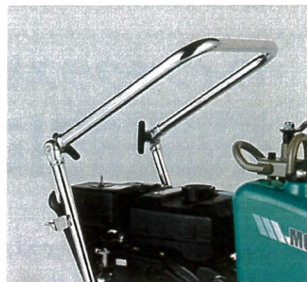
3 中折れハンドル採用