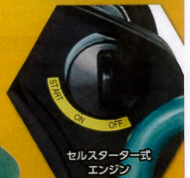
セルスターター式エンジン