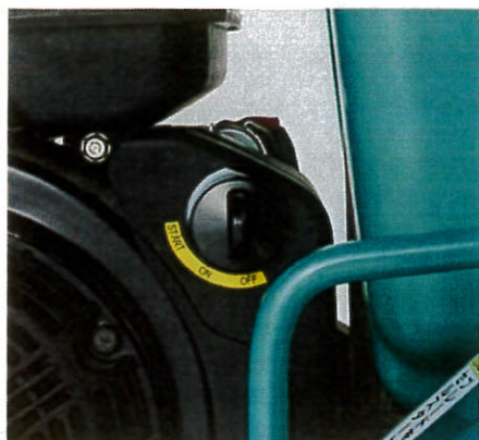
1 セルスタート仕様* (MCD-K12MS)