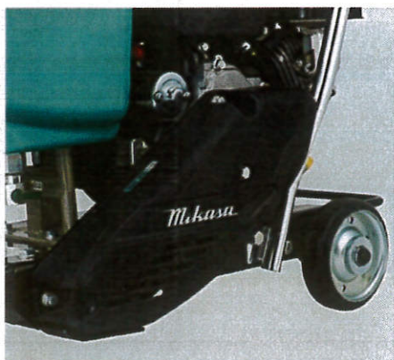
5 高強度の樹脂製ベルトカバー採用