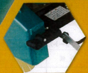
ゴム製接続コネクターの散水ブロックにより散水管の清掃を容易に行えます。