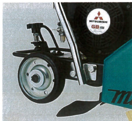
6 駐車ブレーキ採用

*低温時はバッテリーの出力特性が弱くなるためセルスターターでの始動ができない仕様となっております。(故障ではありません) その際は、リコイルスターターで始動してください。リコイルスターターで始動後、エンジンが暖まっている場合は、セルスターターでの始動が可能です。