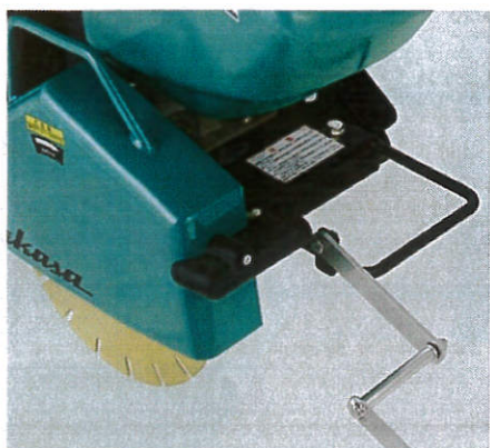
4 清掃を容易にした 散水ホースブロック